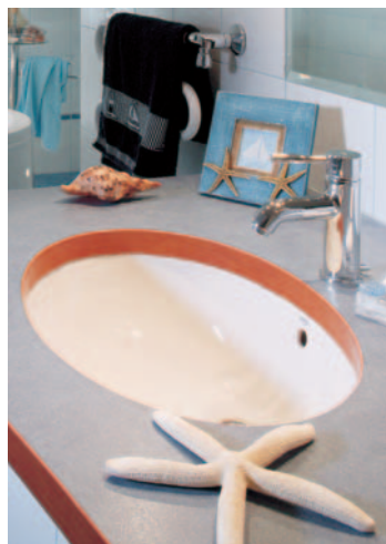
Duży blat okazał się być idealnym miejscem nie tylko dla toaletowych przyborów, ale także dla muszli i rozwiązań.