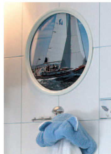
Dwa dekoracyjne bulaje przy kabynie prysznicowej są tak skonstruowane, że gdy obrazek znudzi się dzieciom można go wyjąć i wymienić na inny.