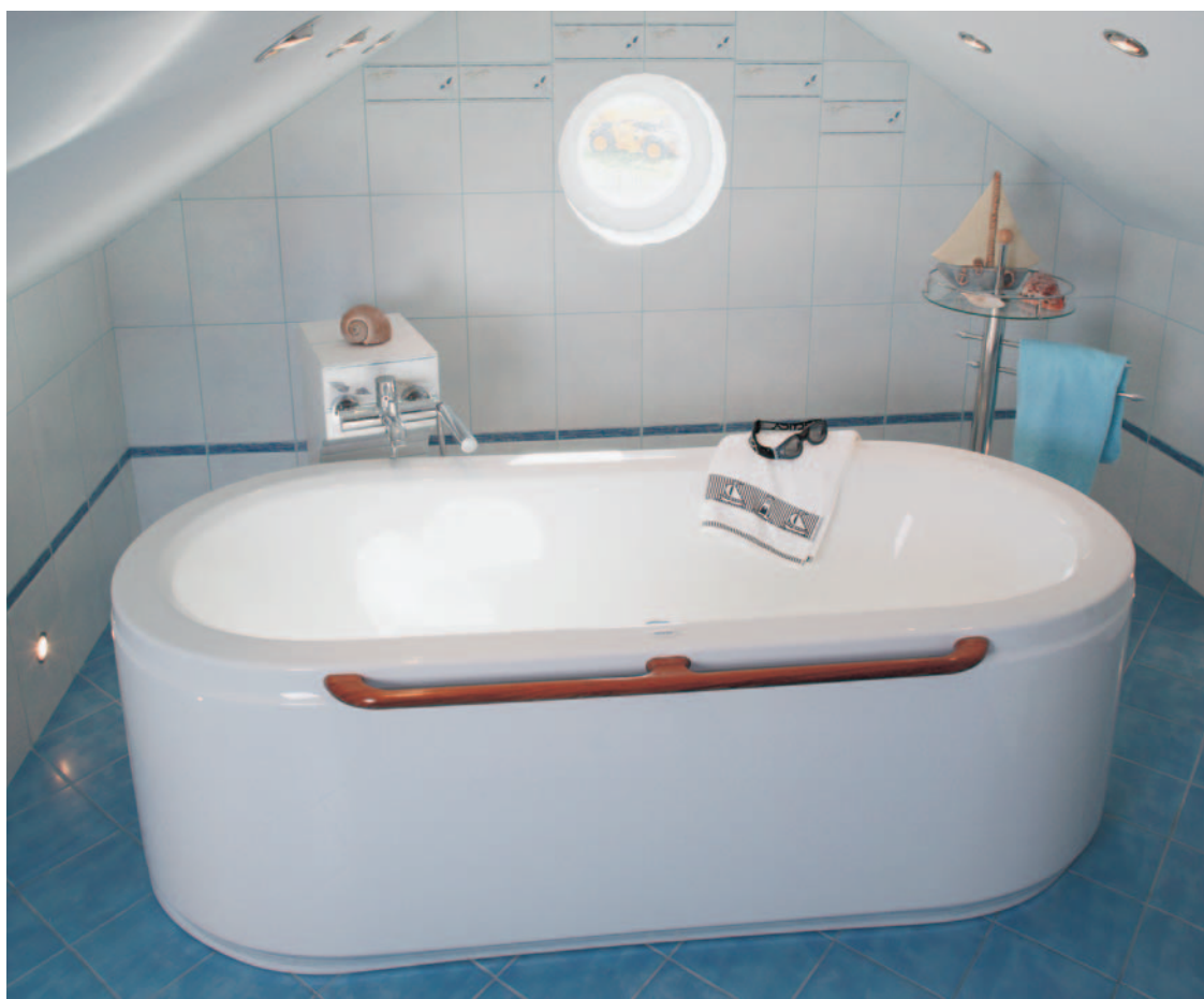
Wolno stojąca wanna jest niczym łódź dryfująca po oceanie. W oddali na płytkach widać mewy, sufit nad głową układa się jak targane wiatrem żagle.

WYPOSAŻENIE I MATERIAŁY: umywalka – Berna, prod. Roca sedes – Meridian, prod. Roca wanna - Jamaica 190, prod. Victory Spa kabina i brodzik – prod. Sanplast baterie – Novello, prod. Deante system spłukiwania – prod. Geberit